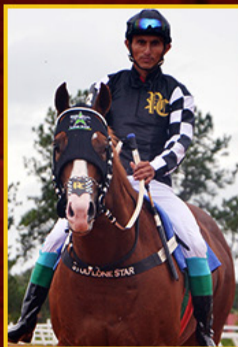
AURA SPECIAL JQM