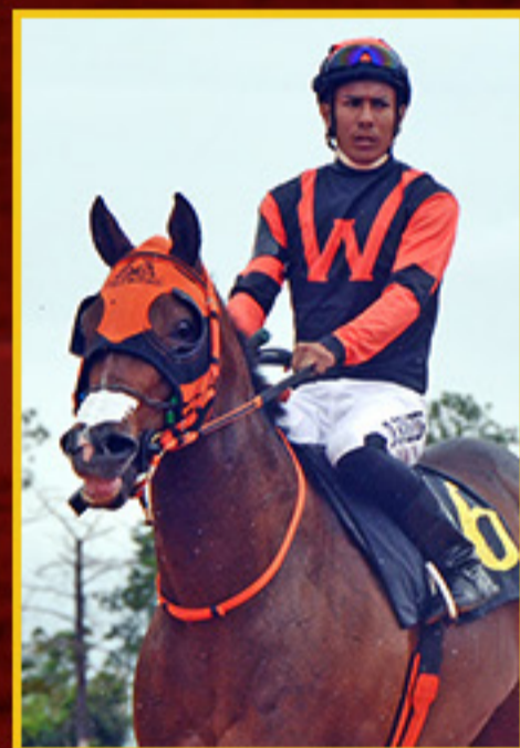
DINASTIA LOAD HW